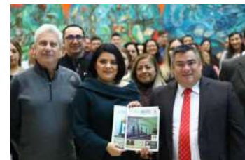
En la presentación de la Revista del Instituto de Investigaciones Parlamentarias del Congreso del Estado de Tamaulipas edición 2024.